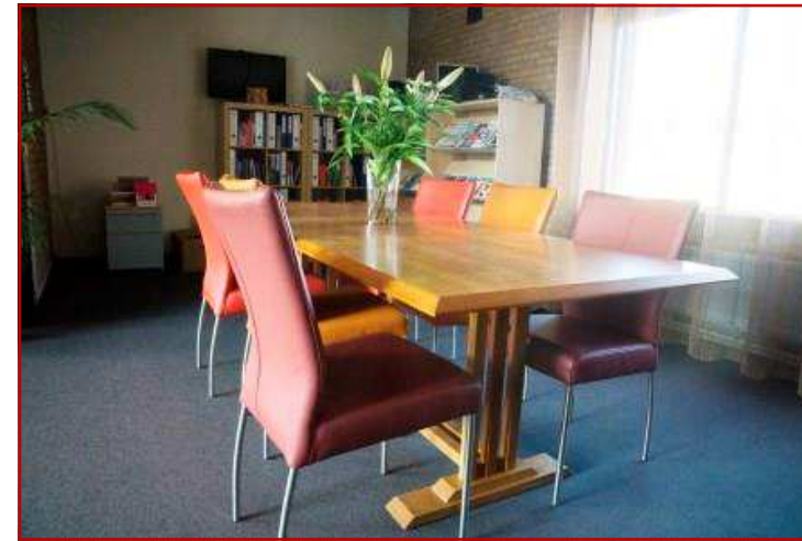
De documentatie hoek

U kunt hier boeken en folders inkijken en op leenbasis mee naar huis nemen.