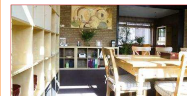
Doorkijk naar documentatiehoek