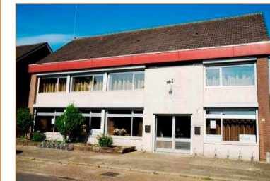
Ons nieuwe pand Evertsenstraat