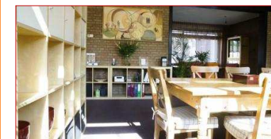
Doorkijk naar documentatiehoek

Activiteitenoverzicht maart - april 2017