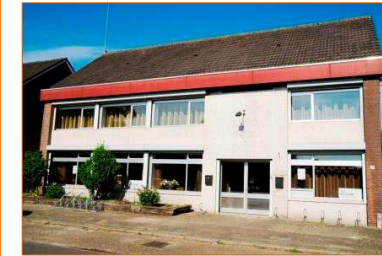
Ons nieuwe pand Evertsenstraat